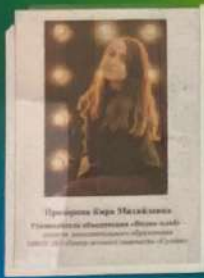
Проектная работа Ученицы образовательного учреждения на тему: «Образование талантов каждого ребёнка»